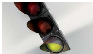
Investieren trotz Kreditklemme