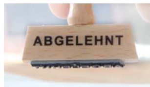
Krankenkassen bleiben beharrlich