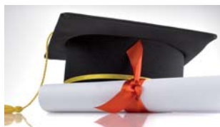
Gleichberechtigung für Psychotherapeuten