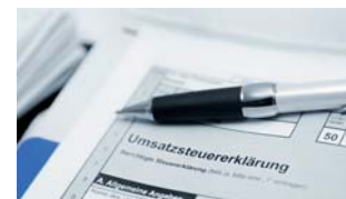
Vitalogisten sind umsatzsteuerpflichtig